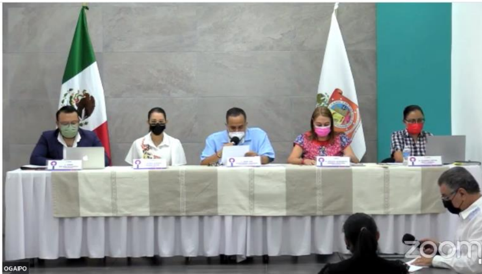
SÉPTIMA SESIÓN ORDINARIA DEL CONSEJO GENERAL