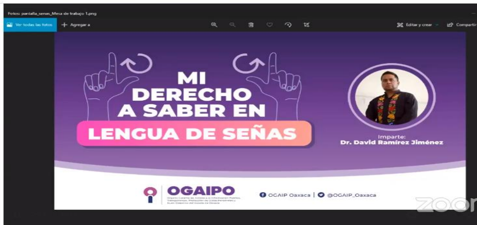
"Mi derecho a saber en Lengua de Señas Mexicana"