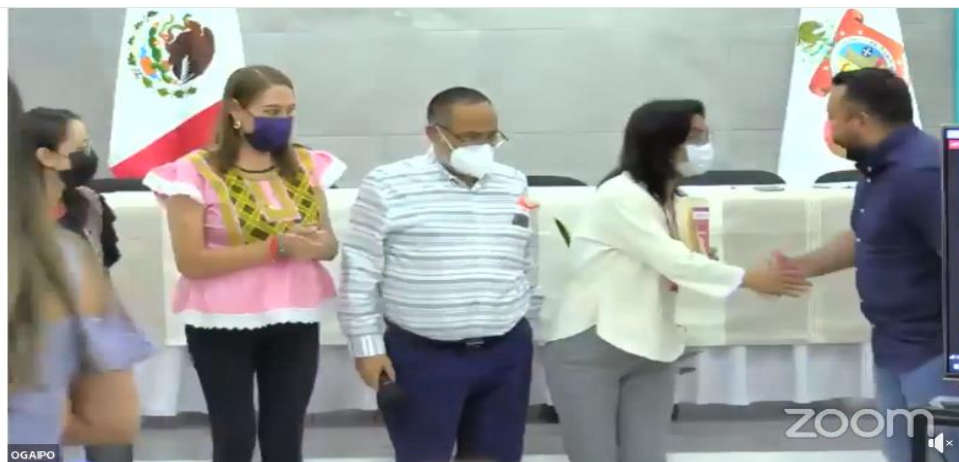
"LA VIOLENCIA DE GÉNERO Y LOS DERECHOS HUMANOS DE LAS MUJE..."